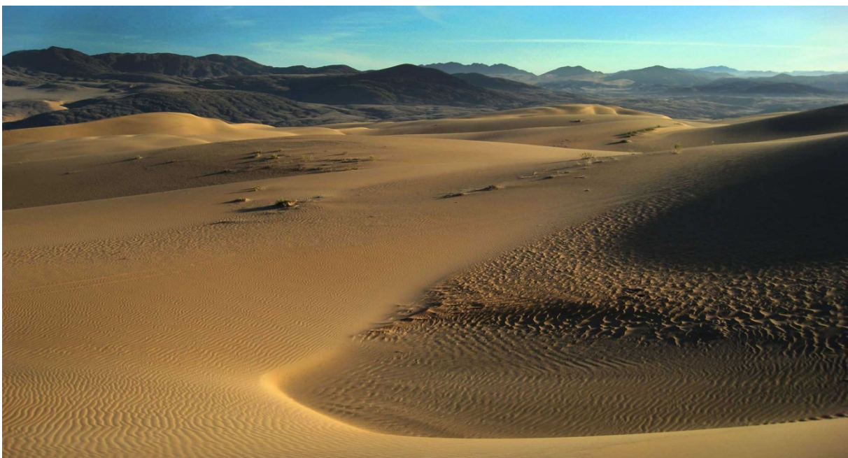
Landschaft im Norden des Kaokolands – Kaokoland Namibia

Es gibt auf dieser Strecke viele Elefanten und auch Löwen. Alles Obst und Gemüse nachts geruchssicher im Fahrzeug vertauen. Am Abend Lagerfeuer aus Sicherheitsgründen anzünden und auf wilden Tieren, besonders bei Dunkelheit, achten. Niemals näher als 200 Meter an Elefanten und Nashörnern heranfahren, da diese sehr aggressiv werden können. Niemals in der Nähe einer Wasserstelle Übernachten, da die Tiere dann nicht zum Trinken kommen und dies besonders für Jungtiere lebensbedrohlich sein kann. Auf dieser Strecke gibt es kaum Mobilfunk Empfang. Satellitentelefon empfohlen und auf jeden Fall jemanden bescheidgeben welche Strecke man wann befahren wird!